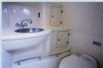
Sopra, il locale toilette completo di wc VacuFlush, lavabo e zona doccia.

Sottocoperta il 285 Conquest dispone di una cabina spaziosa e confortevole. La zona prodiera è occupata da una dinette a U capace di ospitare fino a